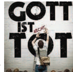
Die Freie evangelische Gemeinde lädt zu einem Filmabend ein.

Im Anschluss an den Film ist ein Gesprächsaustausch über Gott oder den Sinn des Lebens zwischen den Teilnehmern möglich. Angesprochen werden sollen insbesondere alleinstehende, neu zugezogene sowie Menschen, die auf Sinnsuche sind. Der Eintritt zum Filmabend ist frei, für Snacks und Getränke ist gesorgt. Aufgrund der aktuellen Auflagen wird um Anmeldung bis Sonnabend, 31. Oktober, per E-Mail an kinoabend.uelzen@web.de gebeten.