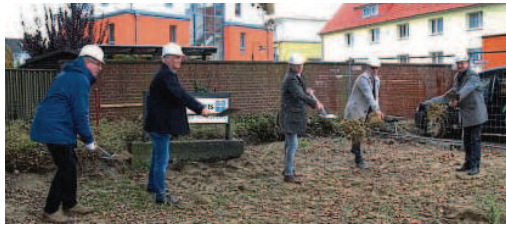
Mit dem symbolischen Spatenstich haben am Mittwoch die Bauarbeiten am neuen Wichern-Haus der Heiligen-Geist-Stiftung begonnen. Es soll im März 2022 fertig sein.

Das neue Wichern-Haus besteht aus zwei großzügig gestalteten Gebäudeflügeln, die durch zwei Atrien verbunden sind. Das dreigeschossige Gebäude verfügt über sechs Wohnbereiche mit je 24 Plätzen. Bezogen werden können überwiegend Einzelzimmer, doch auch Doppelzimmer für Paare soll es geben. Jede Gruppe eines Wohnabschnittes be-