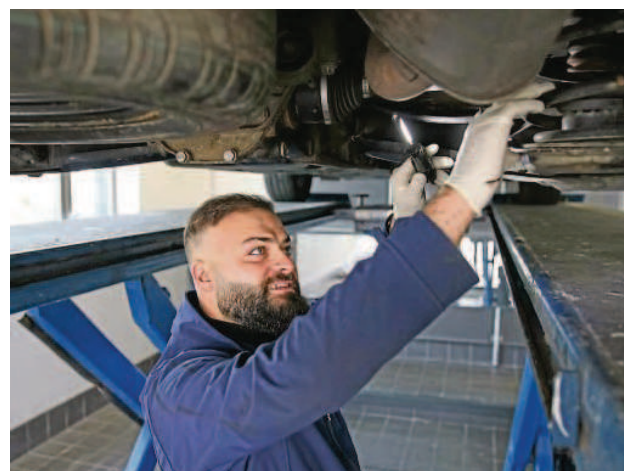
Auf der Suche nach Mängeln am Auto: Der FSP-Prüflingenieur prüft in der Kfz-Hebebühne das Fahrzeug auf Herz und Nieren.

Als Prüflingenieur gehören Hauptuntersuchungen und Änderungsabnahmen genauso zu seinem Beruf wie Oldtimergutachten und Gasanlagenprüfungen. Doch die Kfz-Prüfstelle der gemeinsamen Marke „Tüv Rheinland / FSP“